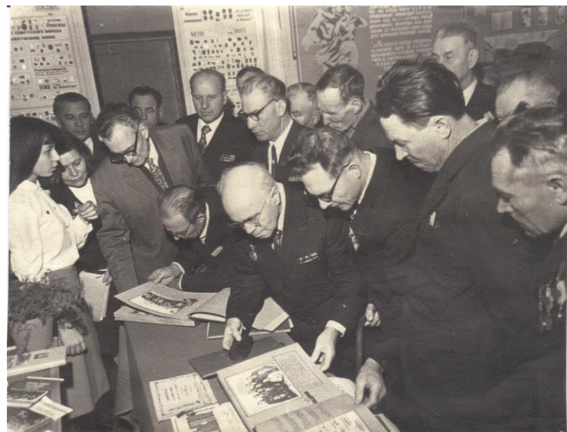
Встреча ветеранов 19 КПТК в Музее истории школы №13